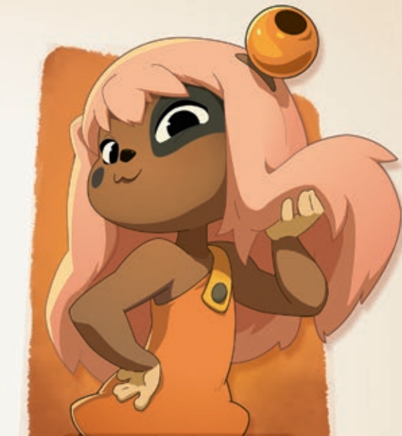
◆ LILOTTE ◆

Jeune fille sérieuse et posée, Bakara est une apprentie mage très douée. Elle fait la fierté de ses professeurs ! La ligne de conduite qu'elle s'est imposée lui assure sans aucun doute un avenir brillant. Mais sous ses airs très assurés, Bakara est timide et même un peu coincée... Des rencontres et une bonne petite aventure lui feraient le plus grand bien !