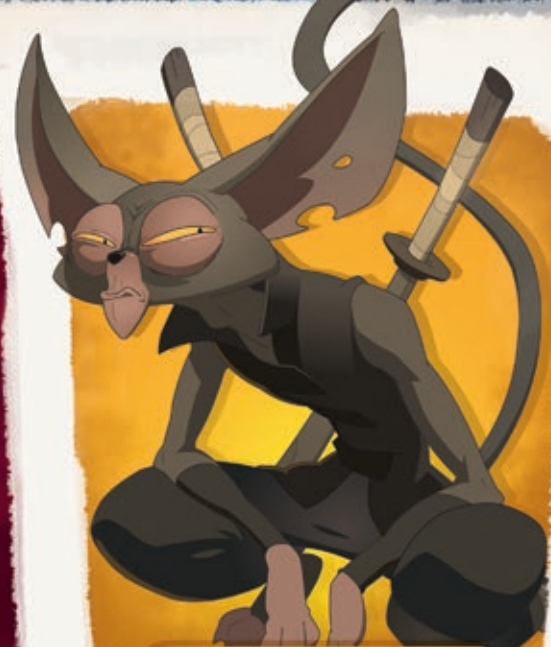
◆ ATCHAM ◆