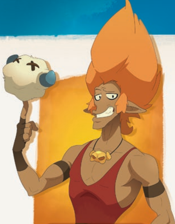
◆ KHAN ◆

Khan est une vraie star, de celles qui suscitent d'impressionnants mouvements de foule. Son domaine de prédilection, c'est le Boufbowl : il n'y peut rien, il est né en étant le meilleur joueur de sa génération. Partout où il passe, la Boufballe trépasse. Son statut de légende du ballon à cornes fait de lui une personne exigeante, physiquement au top et légèrement imbue d'elle-même... Khan est le meilleur et on l'adore pour ça, c'est tout ce qui compte après tout !