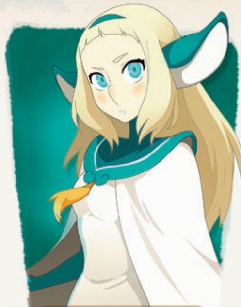
◆ BAKARA ◆

Khan est une vraie star, de celles qui suscitent d'impressionnants mouvements de foule. Son domaine de prédilection, c'est le Boufbowl : il n'y peut rien, il est né en étant le meilleur joueur de sa génération. Partout où il passe, la Boufballe trépasse. Son statut de légende du ballon à cornes fait de lui une personne exigeante, physiquement au top et légèrement imbue d'elle-même... Khan est le meilleur et on l'adore pour ça, c'est tout ce qui compte après tout !