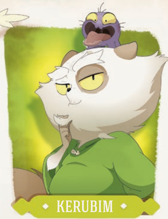
◆ KERUBIM ◆

Joris vit avec son Papycha, Kerubim Crépin, qui lui raconte régulièrement ses péripéties de jeunesse toutes plus folles les unes que les autres. À force de les entendre, il rêve d'une vie d'aventure ! C'est aussi peut-être pour ça qu'il imagine toujours ses parents en héros : magiciens superpuissants, athlètes légendaires ou aventuriers de l'extrême ! Il sait très peu de choses sur eux, alors en attendant, Joris s'est constitué une famille bien à lui avec Lilotte, Luis et bien sûr Kerubim.